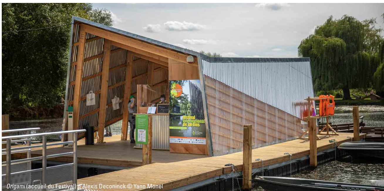
Origami (accueil du Festival) d'Alexis Deconinck

L'histoire des Hortillonnages étant intimement liée à la culture maraichère, l'une des œuvres paysagère retenue sera liée à cette thématique et impliquera une redistribution des récoltes à des associations caritatives.