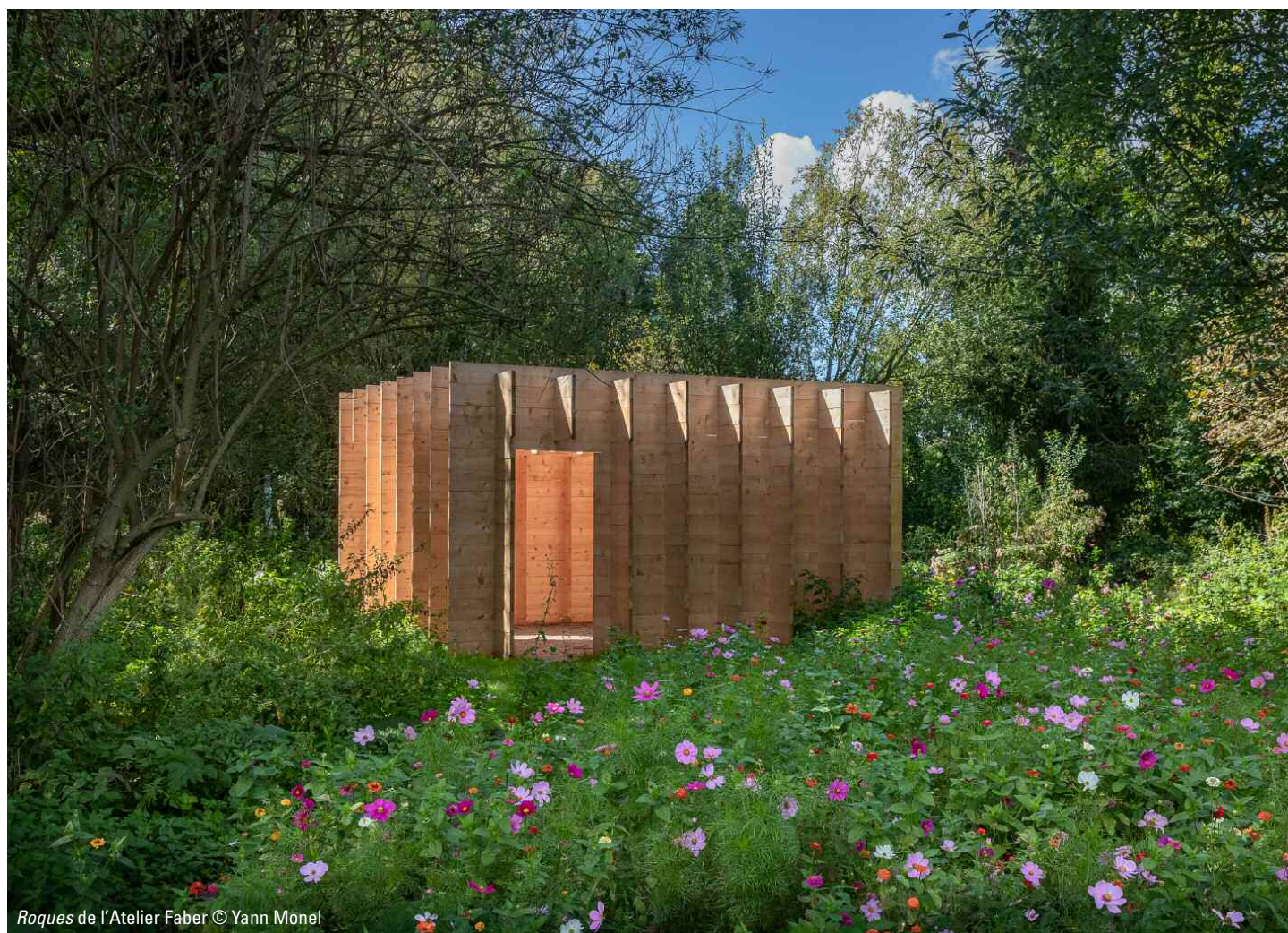
Roques de l'Atelier Faber

Candidature à renvoyer au plus tard le 22 décembre 2020