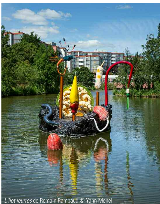
L'îlot leurres de Romain Rambaud

Les œuvres réalisées pourront être éphémères (au minimum pour la durée d'ouverture au public du 22 mai au 17 octobre 2021 ) ou semi-pérennes. Un comité artistique se réunit à la clôture du Festival pour décider des œuvres reconduites.