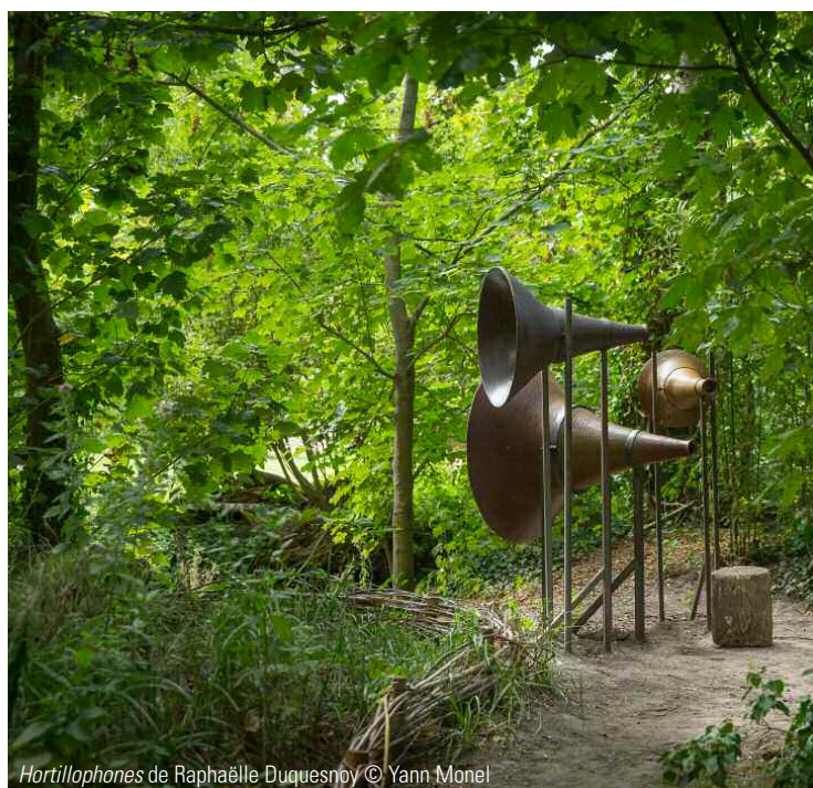
Hortillaphones de Raphaëlle Duquesnoy