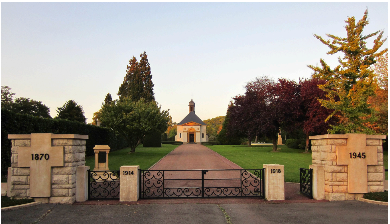
L'entrée de la Nécropole, vue de face