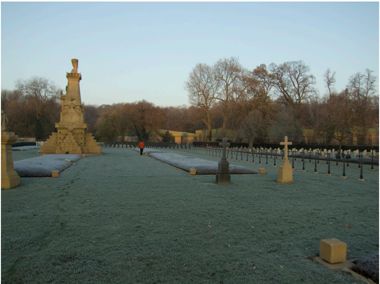
Vue d'une partie de la nécropole

La nécropole est inscrite au titre des monuments historiques par arrêté du 28 décembre 2017. Des autorisations seront donc nécessaires avant la réalisation du jardin.