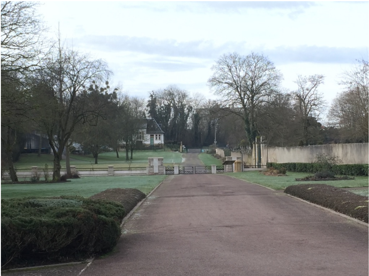
Vue depuis la Chapelle, avec au fond, à gauche, le site / View from the Chapel, with the site in the background on the left

À l'issue de la réalisation, les artistes devront remettre aux organisateurs une fiche d'entretien, complète et explicite, de leur jardin. Par la suite, le ministère des armées prendra en charge l'entretien, par l'intermédiaire de l'ONACVG.