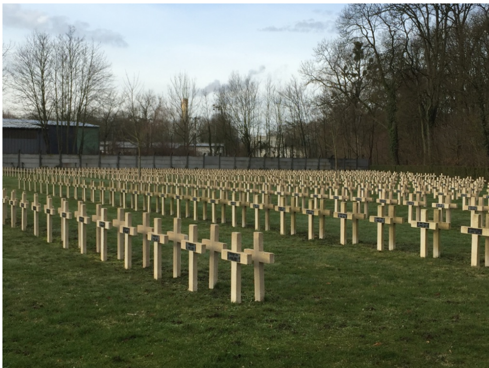
Les sépultures russes

The war precipitated the fall of Tsarism and paved the way for two revolutions which culminated in the signing of a peace treaty with Germany on 3 rd March 1918 and the birth of a new Bolshevik Russia. Russia, in disarray, went from international warfare to a deadly civil war that did not end until 1920.