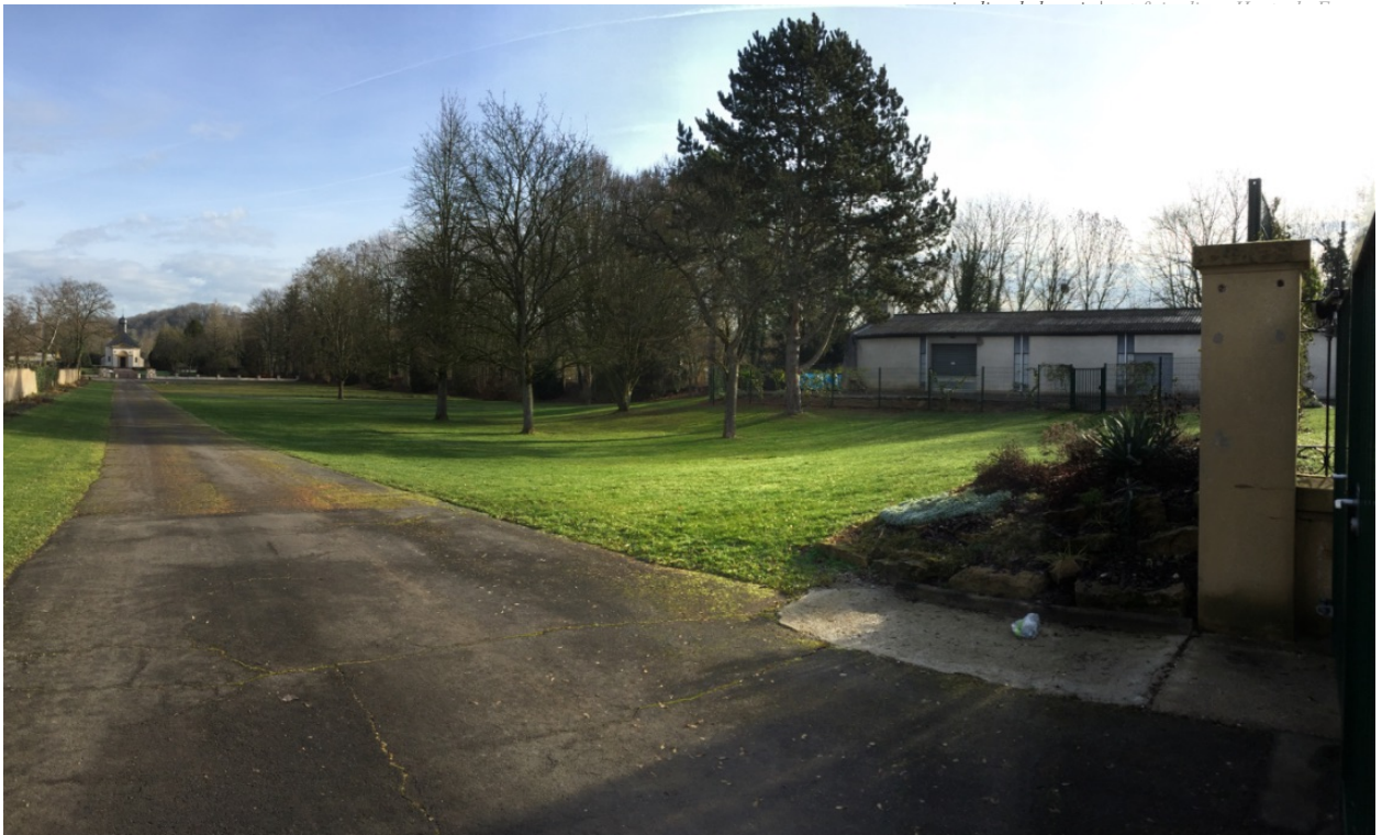
Sur la droite, le site vu depuis l'entrée accessible aux voitures On the right side, the site seen from the entrance accessible to cars

The Russian Garden of Peace in Metz will be located in front of the entrance to the Necropolis, not far from the Jewish cemetery, in the intermediate space used to welcome visitors to the cemeteries. The site is very peaceful.