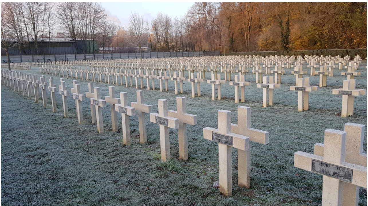
Les sépultures russes

In 1914-18, there were many intermediate camps in the region where French, British and Russian prisoners were held. Some who died were buried in Chambièrre. The area of the necropolis devoted to the 1914-18 war consists of a mosaic of national military cemeteries. The Russian cemetery is considered to be the largest "cemetery for Russian prisoners" on the front. At the bottom of the necropolis, there is a cenotaph to pay homage to the 89 Italian soldiers and 1,280 Russians who died in captivity.