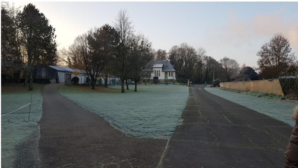
Le site, avec le chemin technique à gauche et la rue des deux cimetières à droite The site, with the technical accès path on the left side and the Rue des deux cimetières on the right side

Further on towards the chapel of the Necropolis, part of the old car park has now been grassed over but is still visible on the satellite view.